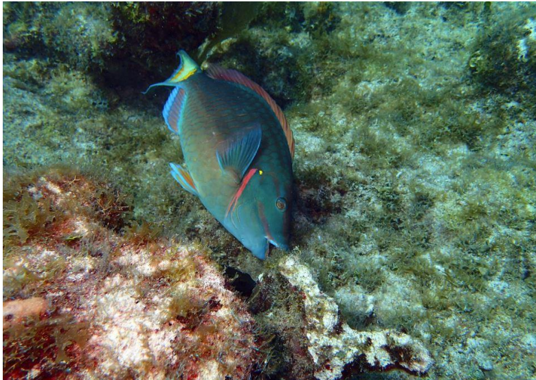
Slika 10. Vrsta Sparisoma viride koja se hrani algama s obrasle površine.

matriksima algi bi rezultiralo širenjem biljnog materijala koji bi prekrrio dostupne površine (Slika 10), što bi prigušilo ostalu floru tog područja (Arnold i sur., 2010).