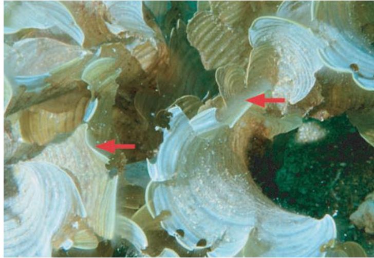
Slika 8. Vidljivi ugrizi na smeđoj makroalgi Padina gymnospora ((Kützing) Sonder, 1871) koje je ostavila vrsta Sparisoma axillare (Steindachner, 1878) hraneći se epifitima koji su česti stanovnici na ovoj vrsti alge.

Takvo ponašanje ukazuje na to, da ako papigače imaju mogućnost izbora, odabrat će nutritivno bogatije epifite umjesto vlaknastijih dijelova morskih biljaka (Clements i sur., 2017). Epifiti su svi organizmi koji nastanjuju površinu biljke. U morskom svijetu epifiti mogu biti: bakterije, alge, gljive, spužve, mješćićnice, mahovnjaci, praživotinje, različite vrste račića i beskralježnjaka, te ostale vrste sesilnih organizama koji nastanjuju površinu biljke (Thornber i sur., 2016). Velika je raznolikost epifita koji nastanjuju površinu neke morske biljke, što papigači može predstavljati pravi švedski stol visoke nutritivne vrijednosti. Zbog toga nije neobično što papigače ostavljaju samo nekoliko ugriza po biljci. One ciljano „počiste“ velike nakupine epifita, te kada ih istrijebe, prijeđu na drugo područje bogato ovim malim organizmima visoke hranjive vrijednosti.