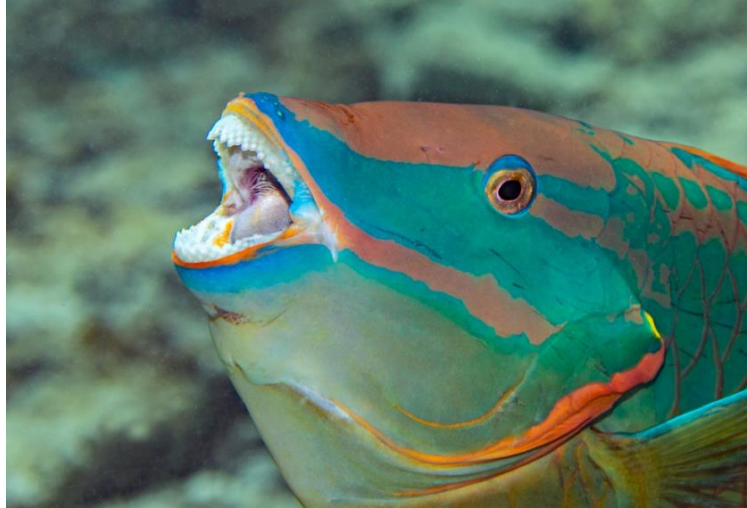
Slika 9. Prikaz zubala vrste Sparisoma viride koje je odlično prilagođeno za struganje i iskopavanje algi.

Ova vrsta je stanovnik koraljnih grebena od Bermuda do Brazila (Froese i Pauly, 2019). Hrani se struganjem i iskopavanjem epilimničkih i endolimničkih algi s karbonatnih supstrata. Vrste S. viride odgovaraju zajednice algi, odnosno epilimnički matriksi algi jer su oni bogati proteinima, sadrže visoku energetska vrijednost te tako zadovoljavaju sve metaboličke zahtjeve ove vrste (Bruggemann i sur., 1994).