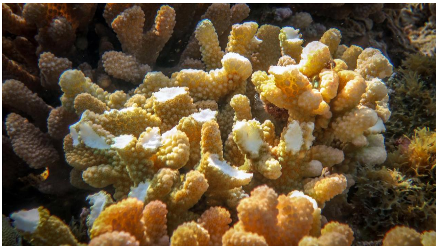
Slika 5. Ugrizi vrste Bolbometopon muricatum na koraljima.

Navedeni rezultati ukazuju na važnost biljojednih vrsta papigača (većina iz porodice Scaridae) i pokazuju kako njihova kontrola rasta zajednica algi ima utjecaj na cijeli sustav koraljnog grebena, odnosno imaju utjecaj na zdravlje čitavog grebenskog ekosustava. Svojom konzumacijom algi uklanjaju glavne kompetitore za prostor te na taj način omogućuju koraljima neometan razvitak. Nadalje, pospješuju cirkulaciju morske vode koja je neophodna za polipe koji grade koralje. Rezultati pokazuju kako papigače čija se ishrana sastoji isključivo od polipa, nemaju pretjerano negativan utjecaj na koralje jer se oni i dalje nastave razvijati nakon njihovih ugriza. Problem je pretežito estetske prirode jer su takvi ugrizi na koraljima vrlo uočljivi (Slika 5).