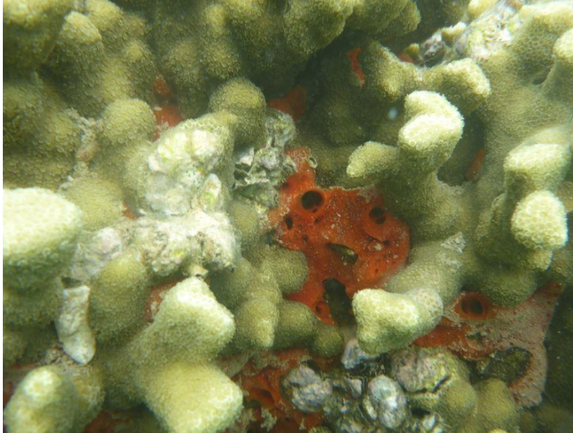
Slika 7. Vrsta morske spužve Mycale grandis (crveno) koja uspješno raste između dijelova koralja i na njegovim površinama (izvor: Johnson, 2018).

Nadalje, postoje vrste spužvi koje izlučuju korozivne tvari koje služe za probijanje tunela u stijenama, koraljima te ljušturama uginulih organizama (Ruppert i sur., 2004). Takve se jedinke vrlo brzo i uspješno šire. Sposobne su ukloniti i do metar karbonatnog materijala godišnje s grebena, ostavljajući u tom procesu vidljive usjeke (Bergquist, 1978). Promatrano iz ove perspektive, papigače bi istrebljivanjem ovakvih vrsta spužvi imale pozitivan učinak na ekosustav jer bi se riješile „parazitskih“ spužvi koje stvaraju pritisak na brojne vrste svojom invazivnom prirodom.