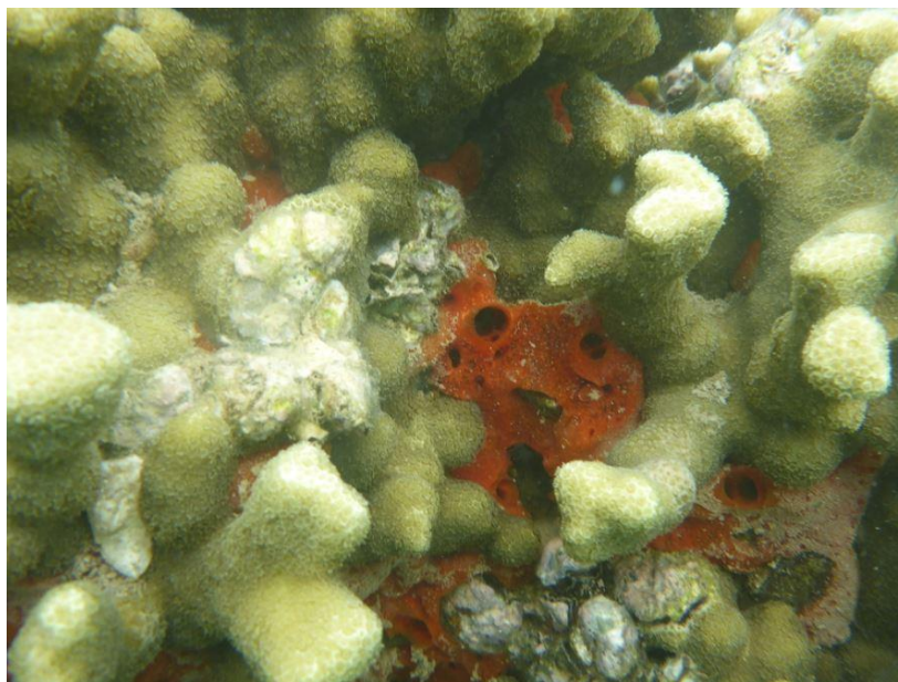
Slika 7. Vrsta morske spužve Mycale grandis (crveno) koja uspješno raste između dijelova koralja i na njegovim površinama.

Nadalje, postoje vrste spužvi koje izlučuju korozivne tvari koje služe za probijanje tunela u stijenama, koraljima te ljušturama uginulih organizama (Ruppert i sur., 2004). Takve se jedinke vrlo brzo i uspješno šire. Sposobne su ukloniti i do metar karbonatnog materijala godišnje s grebena, ostavljajući u tom procesu vidljive usjeke (Bergquist, 1978). Promatrano iz ove perspektive, papigače bi istrebljivanjem ovakvih vrsta spužvi imale pozitivan učinak na ekosustav jer bi se riješile „parazitskih“ spužvi koje stvaraju pritisak na brojne vrste svojom invazivnom prirodom.