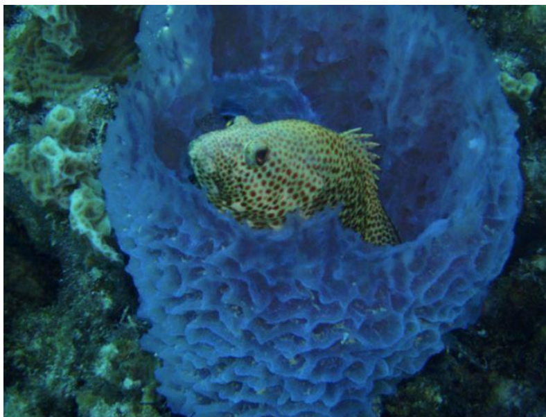
Slika 6. Epinephelus adscensionis (Osbeck, 1765) u šupljini spužve (izvor: Coccaro, 2008).

Cijanobakterije su najvažnija skupina fotosintetskih simbionata spužvi te one mogu uzrokovati različite morfološke promjene kod njih (Taylor, 1973). One su sposobne fotosintetizirati velike količine kisika (do tri puta više kisika nego što troše) i stvaraju mnogo organske tvari koju dalje mogu konzumirati ostali organizmi (Bergquist, 1978). Takva opskrba staništa resursima je značajna za cijelu mrežu morskog ekosustava. Papigače bi pretjeranom ishranom spužvama mogle značajno poremetiti ravnotežu. Uništavajući spužve, uklanjaju njihove endosimbionte uključujući i cijanobakterije koje su važne za opskrbu okoliša resursima. Ako u okolišu nedostaje kisika i organske tvari, primarna proizvodnja se značajno smanjuje, čime dolazi do reducirane proizvodnje na svim sljedećim hranidbenim razinama sve do vršnog predatora. U ovom se slučaju utjecaj papigača ne odražava samo na područje koraljnog grebena, već na mnogo šire područje. Osim što se ugrožava opskrba kisikom i organskom tvari, smanjuje se stopa kruženja ugljika, silicija i dušika u čijem recikliranju spužve imaju značajnu ulogu (Bell, 2008).