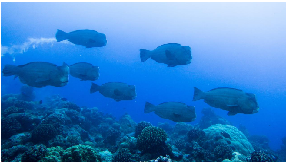
Slika 11. Jedinka Bolbometopon muricatum koja istovremeno ispušta feces i fini sediment u morski okoliš.

Papigače proizvode sediment tako što svojim ždrijelnim čeljustima usitne hranu na vrlo sitne komadiće te sav neprobavljeni materijal izlazi s fecesom (Tebbett i sur., 2017). Kako su papigače strugači i kopači supstrata, često se u njihovoj ciljanoj hrani mogu pronaći komadi supstrata koji nakon što je usitnjen, pridonosi stvaranju finih sedimenata. Taloženje sedimenta nastalog aktivnošću papigača se najviše odvija u području unutrašnje strane grebena (područje od obale do najvišeg vrha grebena), u usporedbi s najvišim točkama grebena na svim lokacijama širom kontinentalnog pojasa (Hoey i Bellwood, 2008). Nadalje, zabilježeno je kako papigače proizvode više sedimenta na vrhovima grebena, nego na zaštićenim, unutrašnjim područjima (Hoey i Bellwood, 2008). Ti se sedimenti sastoje od krupnijih zrna (Hoey i Bellwood, 2008), što ukazuje na veći utjecaj hidrodinamičkih aktivnosti koje ne dopuštaju da se taloži fini sediment. Papigače ispuštaju sediment izravno u vodeni stupac zajedno s fecesom (Slika 11) i time pomažu transportu finog sedimenta u okoliš. U tom procesu značajnu ulogu ima hidrodinamika koja može transportirati takav materijal 100 metara dalje od točke ispuštanja. Sediment transportom često završi na zaštićenim, zatvorenim stranama grebena (Bellwood, 1996).