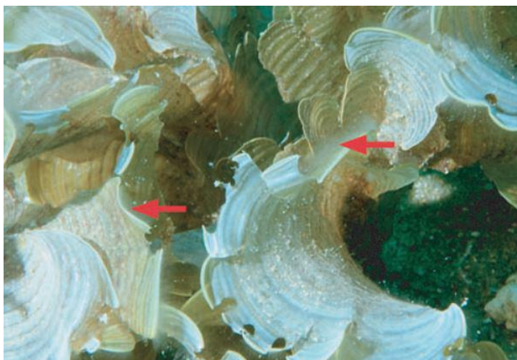
Slika 8. Vidljivi ugrizi na smeđoj makroalgi Padina gymnospora ((Kützing) Sonder, 1871) koje je ostavila vrsta Sparisoma axillare (Steindachner, 1878) hraneći se epifitima koji su česti stanovnici na ovoj vrsti alge.

Takvo ponašanje ukazuje na to, da ako papigače imaju mogućnost izbora, odabrat će nutritivno bogatije epifite umjesto vlaknastijih dijelova morskih biljaka (Clements i sur., 2017). Epifiti su svi organizmi koji nastanjuju površinu biljke. U morskom svijetu epifiti mogu biti: bakterije, alge, gljive, spužve, mješćićnice, mahovnjaci, praživotinje, različite vrste račića i beskralježnjaka, te ostale vrste sesilnih organizama koji nastanjuju površinu biljke (Thornber i sur., 2016). Velika je raznolikost epifita koji nastanjuju površinu neke morske biljke, što papigači može predstavljati pravi švedski stol visoke nutritivne vrijednosti. Zbog toga nije neobično što papigače ostavljaju samo nekoliko ugriza po biljci. One ciljano „počiste“ velike nakupine epifita, te kada ih istrijebe, prijeđu na drugo područje bogato ovim malim organizmima visoke hranjive vrijednosti.