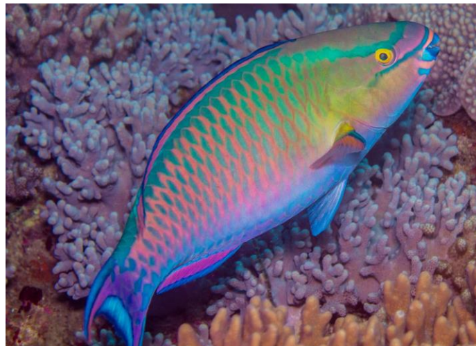
Slika 1. Vrsta Scarus tricolor u svom prirodnom staništu.

U svjetskim morima obitava veliki broj živopisnih vrsta riba koje svojim djelovanjem imaju određeni utjecaj na okoliš. Jedne od takvih su papigače koje spadaju u porodicu Scaridae koja se dijeli na 10 rodova (Parenti i Randall, 2011): Bolbometopon (Smith, 1956), Cetoscarus (Smith, 1956), Chlorurus (Swainson, 1839), Calotomus (Gilbert, 1890), Hipposcarus (Smith, 1956), Scarus (Forsskål, 1775), Sparisoma (Swainson, 1839), Cryptotomus (Cope, 1871), Leptoscarus (Swainson, 1839) i Nicholsina (Fowler, 1915). Nalazimo ih u tropskim i suptropskim područjima, a izgledom se ističu svojim širokim spektrom boja i zadivljujućim uzorcima po cijelom tijelu (Slika 1).