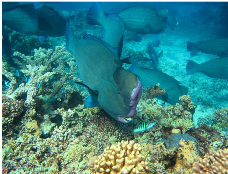
Slika 4. Skupina jedinki Bolbometopon muricatum u potrazi za koraljima.

(Froese i Pauly, 2006). Hrani se isključivo živim koraljima, odnosno polipima (Bellwood i Choat, 1990). Cijeli svoj život provede u okruženju koralja. Juvenilne jedinke borave u skrivenim područjima kako bi se zaštitile od predatora. Često ih se može pronaći u slojevima morske trave ili u staništima razgranatih koralja, dok se odrasle jedinke mogu pronaći u vanjskim lagunama i na morskim grebenima (Hamilton i sur., 2017). Vrsta je vrlo društvena, stoga nije iznenađujuće kada se udruže skupine zelenih grbavih papigača i zajedno kruže oko grebena u potrazi za hranom (Slika 4).