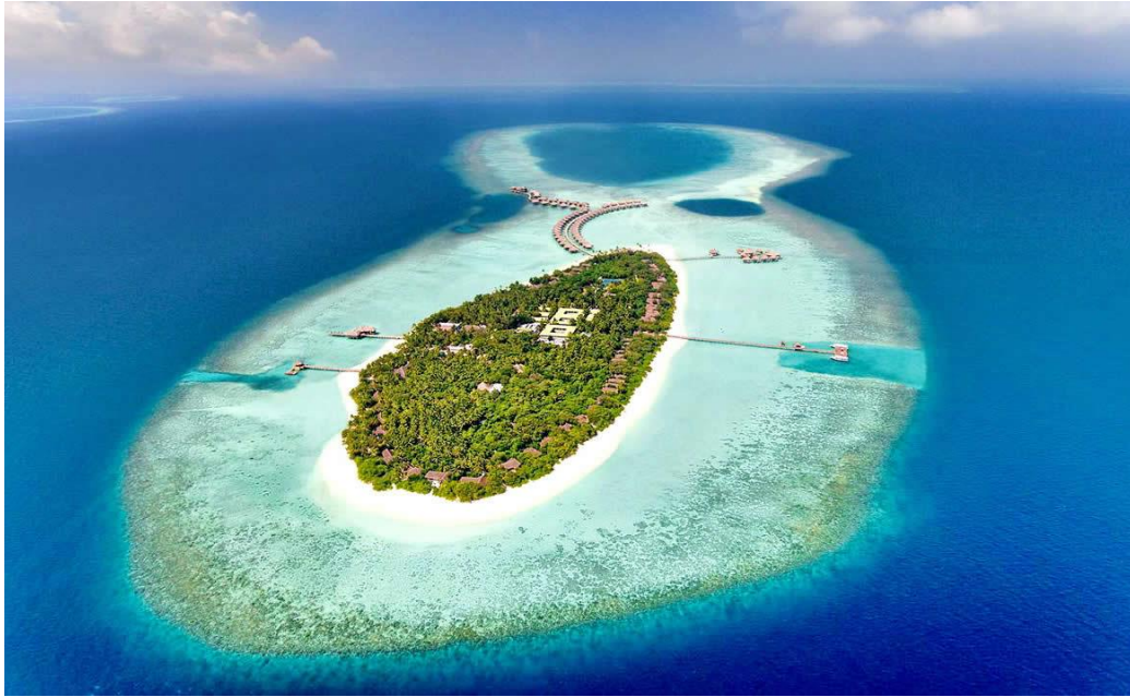
Slika 12. Grebenski otok Vakkaru.