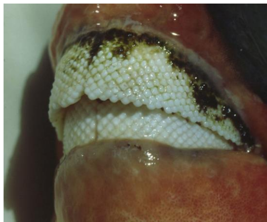
Slika 2. Zubalo vrste Bolbometopon muricatum (izvor: Berkovitz i Shellis, 2017).

Zubalo papigača predstavlja poseban aparat koji je građen u skladu s njihovim načinom prehrane. Njihovi su zubi međusobno srasli i formirali specifično zubalo (Slika 2).