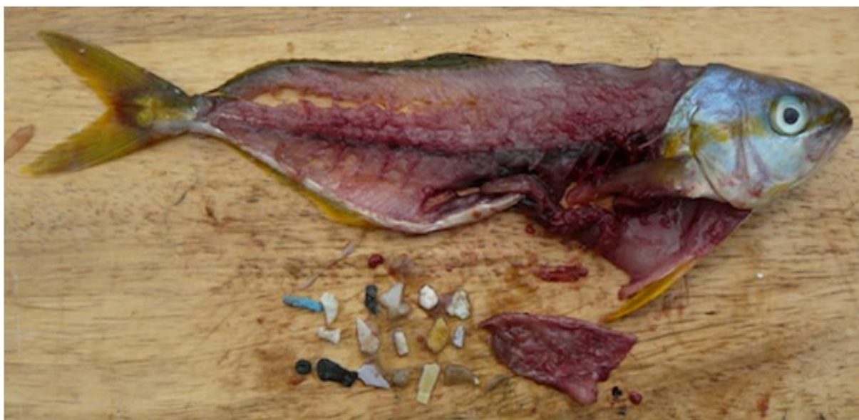
Slika 5. Mikroplastika koja se nalazila u ribi

utjecaj na ljudsko zdravlje i nastanak bolesti (Bendik, 2018) Ftalati, vrsta kemikalija koja se koristi da bi učinila plastiku savitljivom, pojačavaju rast kancerogenih stanica karcinoma dojke (Anonimus, 2019). Nadalje, laboratorijska istraživanja su dokazala učinak mikroplastike na laboratorijske miševе te su rezultati pokazali da se mikroplastika nataložila u njihovoj jetri, bubrezima i tankome crijevu te je povećala razinu oksidacijskog stresa molekula jetre, dok iz tankog crijeva čestice mogu dospjeti u krvotok i potencijalno u druge organe (Bendik, 2018).