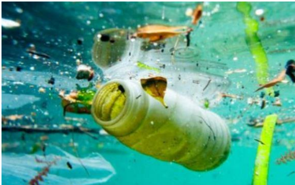
Slika 4. Plastika u moru

U zadnjih 20 godina neprestano raste broj spoznaja o onečišćenju mikroplastikom u morskom okolišu. Osim znanstvenog interesa, postoji sve veći interes javnosti i nevladinih organizacija za sprječavanje navedenog onečišćenja. Znanstvenici naglašavaju važnost daljnjih istraživanja za točniju procjenu količina mikroplastike u morskim staništima diljem svijeta, a posljednjih godina se radi na međunarodnim, nacionalnim i regionalnim smjernicama za kvantificiranje mikroplastike u moru. Okvirna direktiva o morskoj strategiji (MSFD 2008/56/EC) istaknula je zabrinutost zbog utjecaja morskog otpada na okoliš i jedan od ključnih prioriteta MSFD-a je utvrditi ekološku štetu uzrokovanu mikroplastikom i pripadajućim kemikalijama.