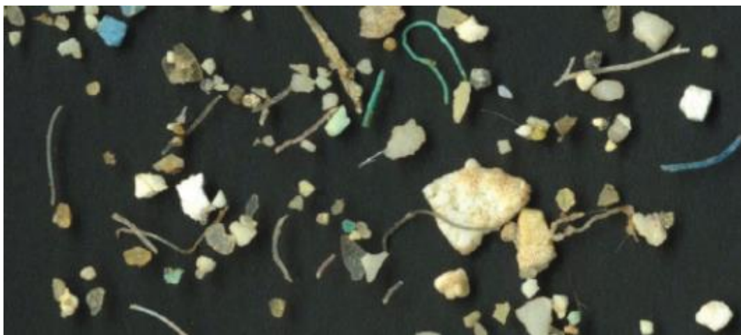
Slika 2. Mikroplastika iz mora.