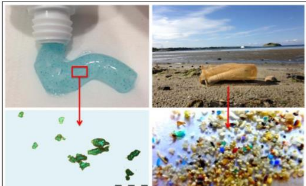
Slika 1. Primjeri mikroplastike iz proizvoda za osobnu higijenu (pasta za zube s lijeve strane) i od razgradnje većih plastičnih površina (s desne strane).

moгу prouzročiti u morskome okolišu, morskim organizmima, ljudskom zdravlju pa i gospodarskim djelatnostima (turizam, ribarstvo).