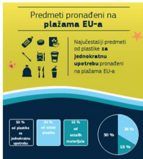
Slika 3. Klasifikacija otpada za jednokratnu uporabu pronađenog na plažama.

Sve većom upotrebom jednokratne plastične ambalaže dolazi do sve većeg nakupljanja plastičnog otpada. Jednokratna plastika se najčešće nalazi u morskom okolišu jer se teško reciklira. Jednokratnu plastiku koja čini 50% ukupnog morskog otpada se najčešće pronalazi na morskim plažama (Slika 3) (Komunikacija Komisije Europskom Parlamentu, Vijeću, Europskom Gospodarskom i Socijalnom Odboru i Odboru Regija, 2018). Usputno konzumiranje hrane i pića povećava sve veću količinu plastičnog otpada, što predstavlja još jedan sve ozbiljniji problem.