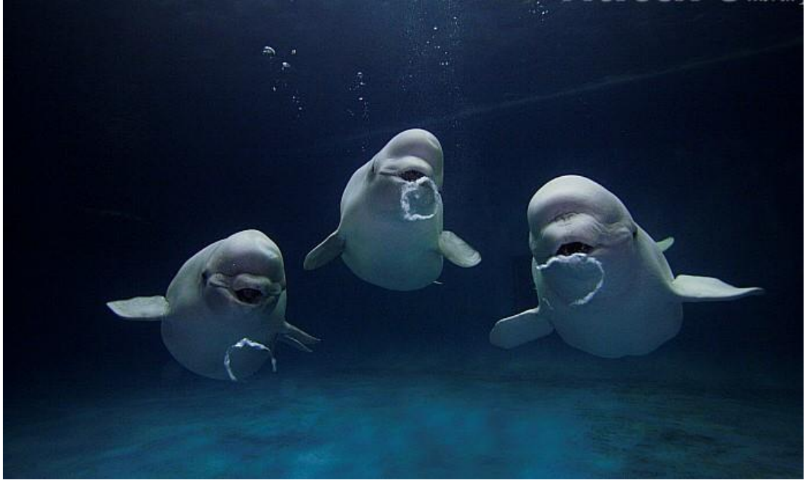
Slika 1. Beluga kitovi ( Delphinapterus leucas ).