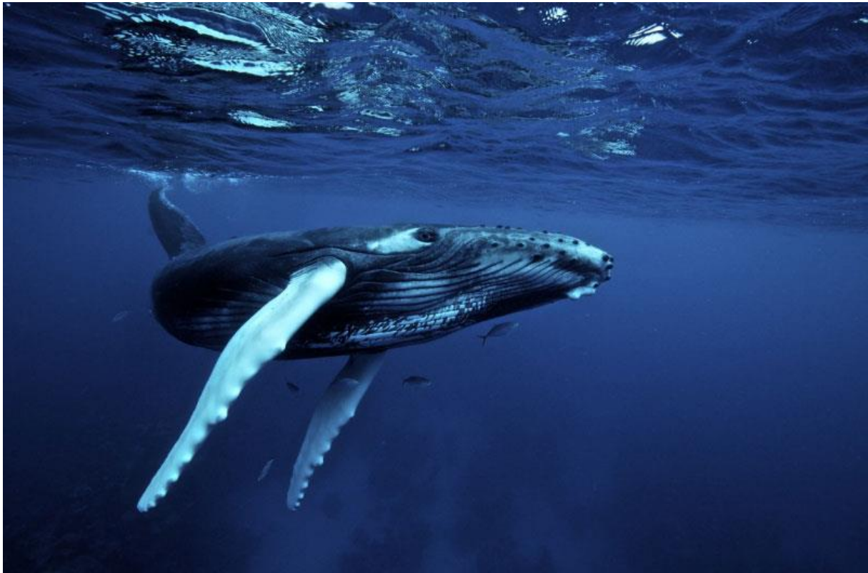
Slika 2. Grbavi kit ( Megaptera novaeangliae ).