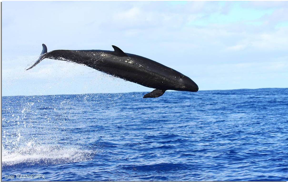
Slika 4. Crni dupin ( Pseudorca crassidens ).