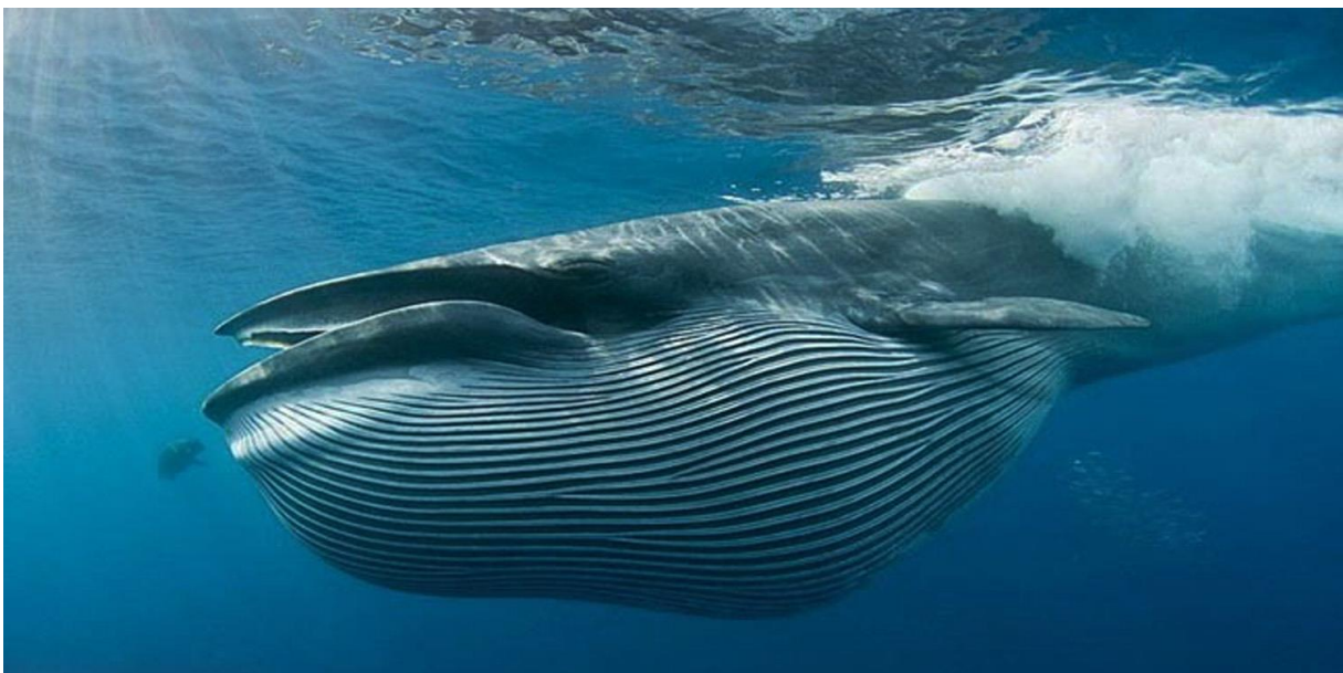
Slika 3. Tropski kit ( Balaenoptera edeni ).

Studija u kojoj se promatralo ponašanje prilikom hranjenja i veličina grupa kod tropskog kita ( Balaenoptera edeni ) i kita perajara ( B. physalus ) sugerira da je kompeticija za hranu razlog zbog kojeg Mysticeti ne formiraju stabilne grupe (Tershy, 1992). Pritom tropski kitovi češće žive solitarno od kitova perajara (Slika 3). Jedan od rijetkih primjera formiranja grupa kod Mysticeta je grupiranje srodno vezanih sivih kitova prilikom migracija iz područja razmnožavanja. Razlog tome je smrtna opasnost koju kitovi ubojice predstavljaju za novorođenu mladunčad koja migrira sa ženkama (Goley i Straley, 1994). Dakle, ako adultne jedinke procjene da će imati koristi udružiti će se sa srodnim jedinkama prilikom migracija. Navedeni primjer pretpostavlja da je kompeticija za hranu manje važna za vrijeme migracija (Swartz, 1986a).