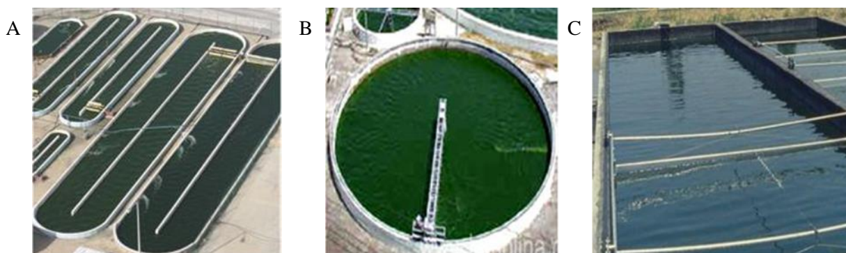
Slika 1. Različiti tipovi bioreaktora otvorenog tipa za uzgoj mikroalgi: „raceway pond“ (A), kružni bazen (B) i bazen bez miješalice (C).

Popularni sustavi za uzgoj mikroalgi su bioreaktori otvorenog tipa (Slika 1.), tzv. „raceway ponds“. To su betonski ili plastični bazeni dubine do 30 cm kojima cirkulira vodeni medij s mikroalgama koji se cijelo vrijeme miješa sa automatiziranim lopaticama (Enzing i sur., 2014). Prednost otvorenog sustava je niska potražnja za energijom, mali operativni troškovi i mali početni kapital (Kratzer i Murkovic, 2021). Međutim, otvoreni sustav ima i svoje mane poput nemogućnosti kontrole uzgojnih parametra. Zbog direktnog kontakta s atmosferom, uzgojni medij je izložen kontaminaciji i zagađenju, isušivanju ili prekomjernom razrjeđenju zbog padalina (Bosak, 2017). Kako je uzgoj podređen vanjskim vremenskim uvjetima, prirast biomase je poprilično nizak, otprilike 0,1 do 25 g/m 2 na dan (Kratzer i Murkovic, 2021). Nekoliko vrsta ipak uspješno raste u otvorenim bioreaktorima jer se uzgajaju u selektivnim uvjetima. Takvi uvjeti dovode do odabranog ekstrema koji je pogodan za rast samo određene vrste dok se inihira rast ostalih sojeva i potencijalnih patogena. Tako se za uzgoj vrste Dunaliella salina koristi medij velikog saliniteta, a za uzgoj Spirulina platensis bazični medij (Enzing i sur., 2014).