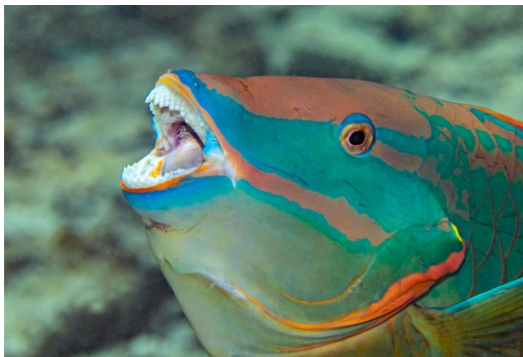
Slika 9. Prikaz zubala vrste Sparisoma viride koje je odlično prilagođeno za struganje i iskopavanje algi (izvor: Nobs, 2022).

Ova vrsta je stanovnik koraljnih grebena od Bermuda do Brazila (Froese i Pauly, 2019). Hrani se struganjem i iskopavanjem epilitnih i endolitnih algi s karbonatnih supstrata. Vrsti S. viride odgovaraju zajednice algi, odnosno epilitski matriksi algi jer su oni bogati proteinima, sadrže visoku energetska vrijednost te tako zadovoljavaju sve metaboličke zahtjeve ove vrste (Bruggemann i sur., 1994).