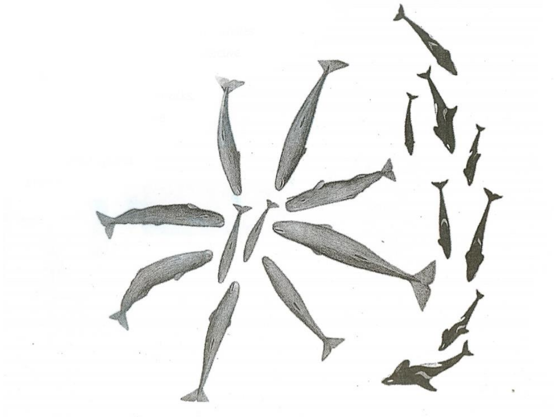
Slika 6. Prikaz „marguerite“ formacije.