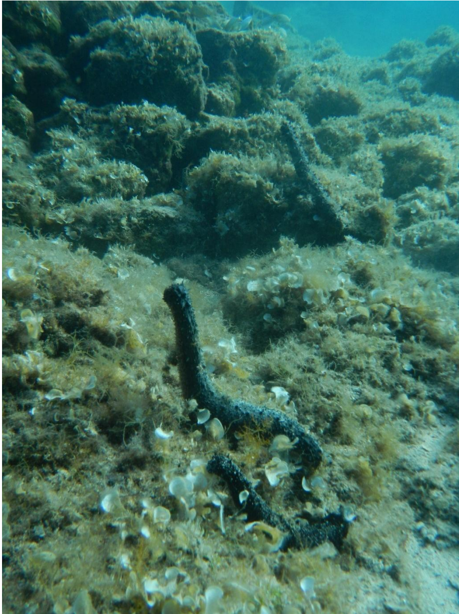
Slika 1. Mrijest mužjaka.

Razvojni ciklus trpova možemo podijeliti na embrionalni stadij, ličinački stadij, juvenilne jedinke i adultne jedinke. Prvi stadij razvoja ličinke poznat je kao auricularia i duga je oko 1 mm (Slika 2). Ova ličinka pliva pomoću duge trake cilija omotane oko njenoga tijela. Razvoj auricularia može se podijeliti u tri stadija: rani, srednji i kasni (Barnes, 1982). Kako ličinka raste, prelazi u drugi stadij koji se naziva doliolaria, s tijelom u obliku bačve i s tri do pet odvojenih prstenova cilija (Slika 3). Treći stadij ličinke je pentacularia (Slika 4). U navedenom stadiju na jedinakama morskog krastavca se pojavljuju ticala (Barnes, 1982).