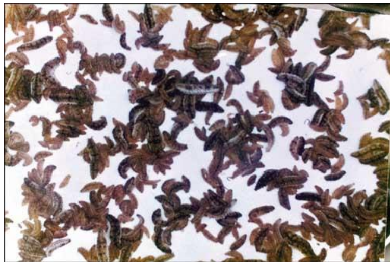
Slika 8. Dvomjesečne uzgojene juvenilne jedinke trpa (izvor: FAO, 2004).

Kad se ličinke razvijaju u juvenilne jedinke, počinju puzati po supstratu, a većina ih ostaje na pločama za naseljavanje. Juvenilne jedinke nakon dva mjeseca dosežu duljinu 20 mm (Slika 8), a nakon četiri mjeseca dostižu 40 mm (Slika 9). Petnaest dana nakon naseljavanja mogu se jasno vidjeti golim okom i tada je potrebno napraviti procijenu broja juvenilnih jedinki. Površina uzorkovanja svakog spremnika mora činiti preko 5% ukupne površine. U svrhu povećanja stope preživljavanja, potrebno je održavati gustoću između 200 i 500 juvenilnih jedinki/m 2 . Naime, autor James i suradnici (1994a) navode da će veća gustoća i nedovoljna količina hrane nepovoljno utjecati na rast i preživljavanje.