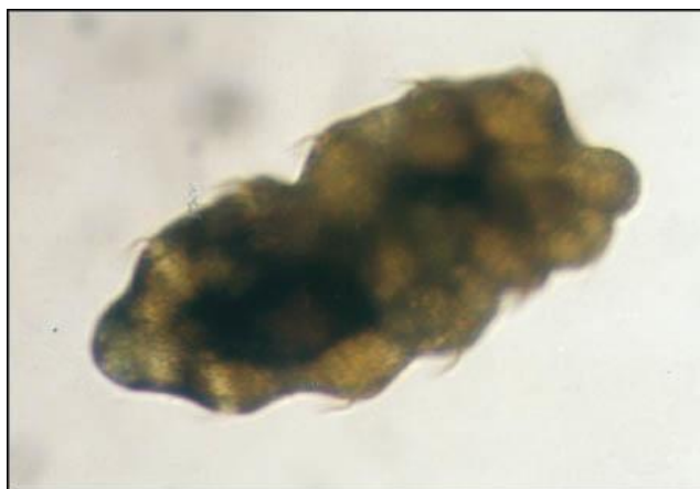
Slika 3. Doliolaria – drugi stadij ličinke trpa.