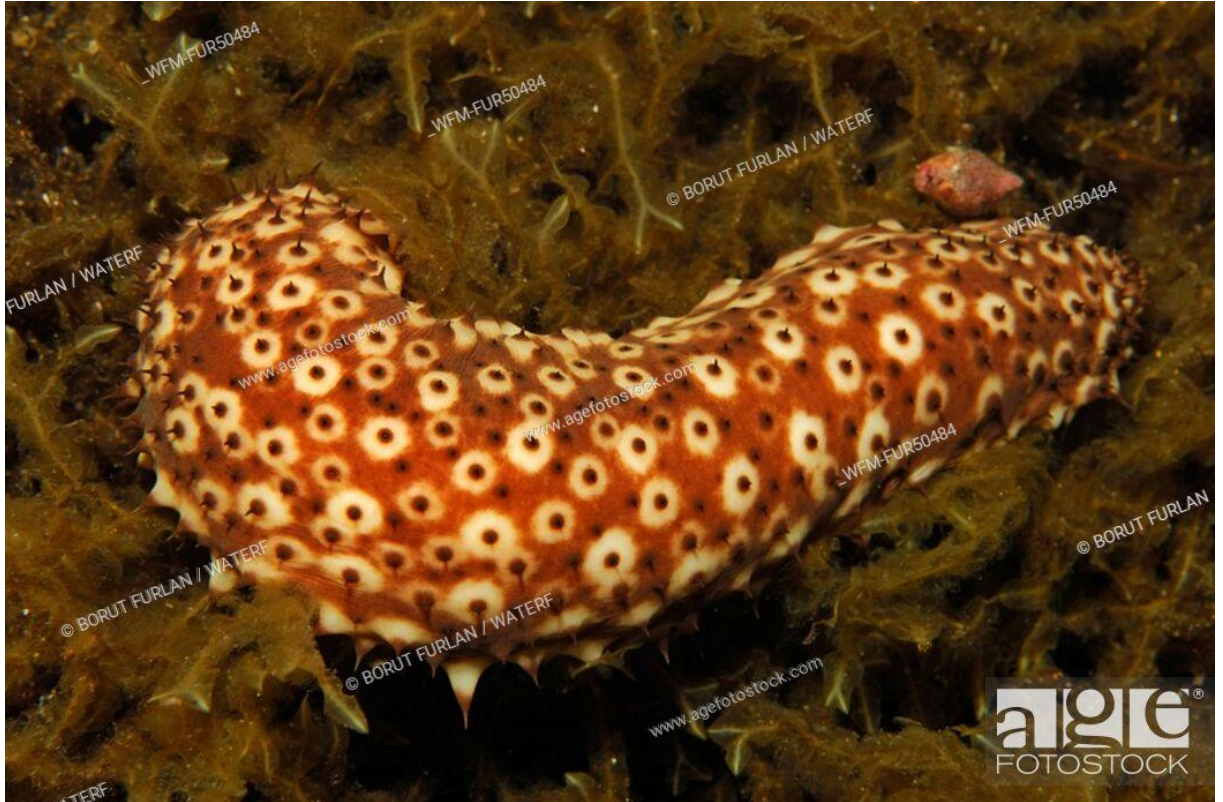
Slika 6. Vrsta Holothuria forskali.

Brizgavac Ocnus planci Brandt, 1835 živi na pjeskovitom i muljevitom dnu u pojasu od 5 do 60 metara dubine (Slika 7). Brizgavac naraste do 15 cm. Jedinke imaju uzdužno na tijelu poredane nožice, papile, pomoću kojih se pokreću. Oko usnog otvora brizgavac ima 10 radijalno postavljenih dugačkih lovki, tj. ima razgranjena ticala (Matoničkin i sur., 1999; Mušin i Marukić, 2007). Temeljna razlika u odnosu na ostale trpove je njegova karakteristika da ne leži na morskome dnu, već je prednjim dijelom tijela uspravljen, a lovkama poredanim oko usnog otvora lovi plankton i ostale hranjive tvari. Boja tijela brizgavca varira od tamno do svijetlo crvene. Mrijest se odvija tijekom proljeća. Najveća rasprostranjenost zabilježena je na području istočnog Atlantika, Sredozemnog i Atlantskog mora. Vrlo je brojan u sjevernom dijelu Jadrana (Matoničkin i sur., 1999; Mušin i Marukić, 2007).