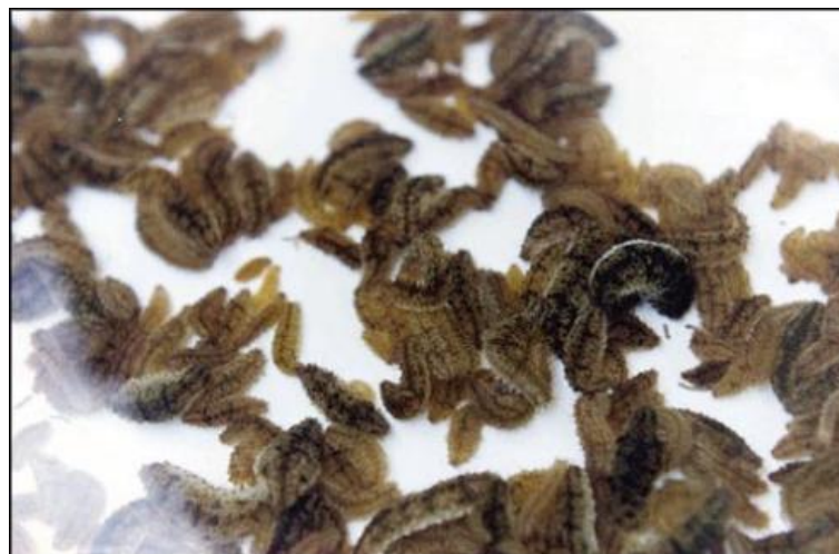
Slika 9. Četveromjesečne uzgojene juvenilne jedinke trpa.