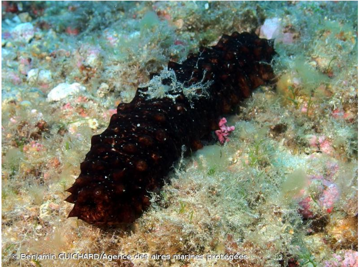
Slika 5. Vrsta Holothuria tubulosa.

planktonski organizmi u vodi. Vrsta je rasprostranjena duž obala istočnog Atlantika, te u cijelom Sredozemnom moru. U Jadranu je rasprostranjen duž cijele obale, u velikom broju (Matoničkin i sur., 1999; Mušin i Marukić, 2007).