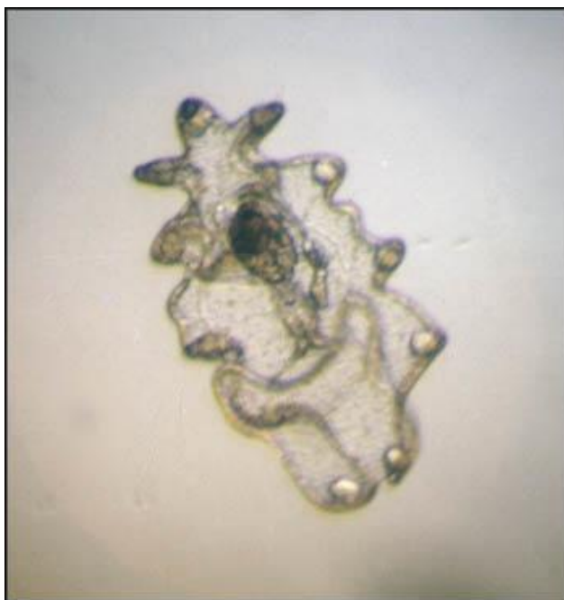
Slika 2. Auricularia - prvi stadij ličinke trpa.