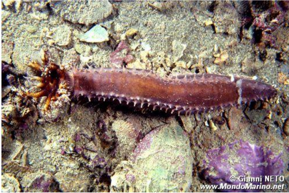
Slika 7. Vrsta Oncus planci (foto: Gianni Neto).